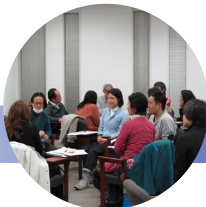
去年のイベントの写真です

このような状況の中、どうしたら子どもたちの性の商品化を食い止めることができるのでしょうか。大人や社会は、子どもたちをこのような被害から守る責任を果たしているのでしょうか。そして、性被害を受けた子どもたちは、どのような支援を必要としているのでしょうか。